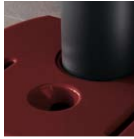
ROSSO BORDEAUX (CON CAVILLO) BORDEAUX (WHIT CRAZING)