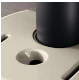
SALE E PEPE SALT AND PEPPER