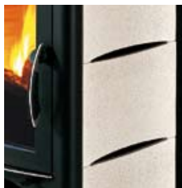
CERAMICA SALE E PEPE SALT AND PEPPER CERAMIC

IN ADDITION TO THE CLADDINGS IN PHOTOS, ARE ALSO AVAILABLE: