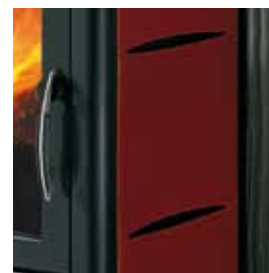
CERAMICA ROSSO BORDEAUX (CON CAVILLO) BORDEAUX CERAMIC (WITH CRAZING)