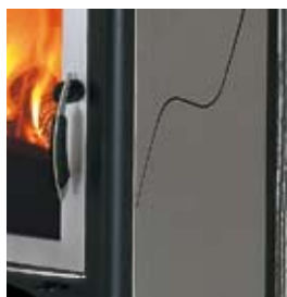
ACCIAIO INOX DESIGN STAINLESS STEEL DESIGN