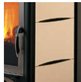
CERAMICA SABBIA SAND-COLOURED CERAMIC